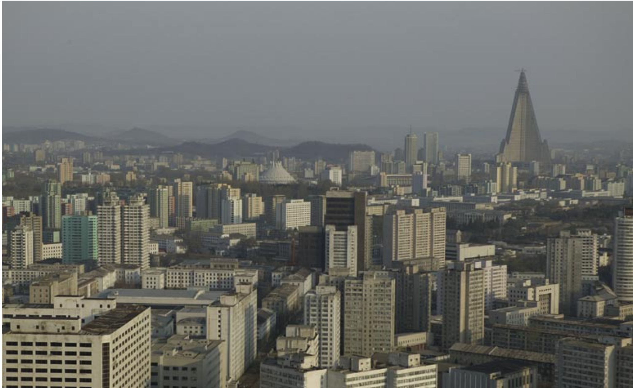
Blick über Pjöngjang, April 2007