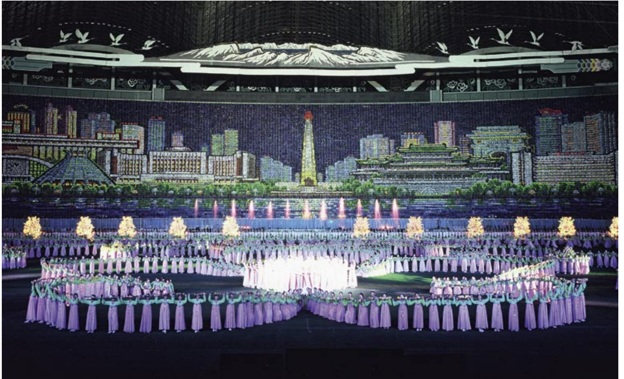
Arirang Festival zum 95. Geburtstag Kim Il Sung's im Rungnado-May-Day-Stadion, Pjöngjang, April 2007