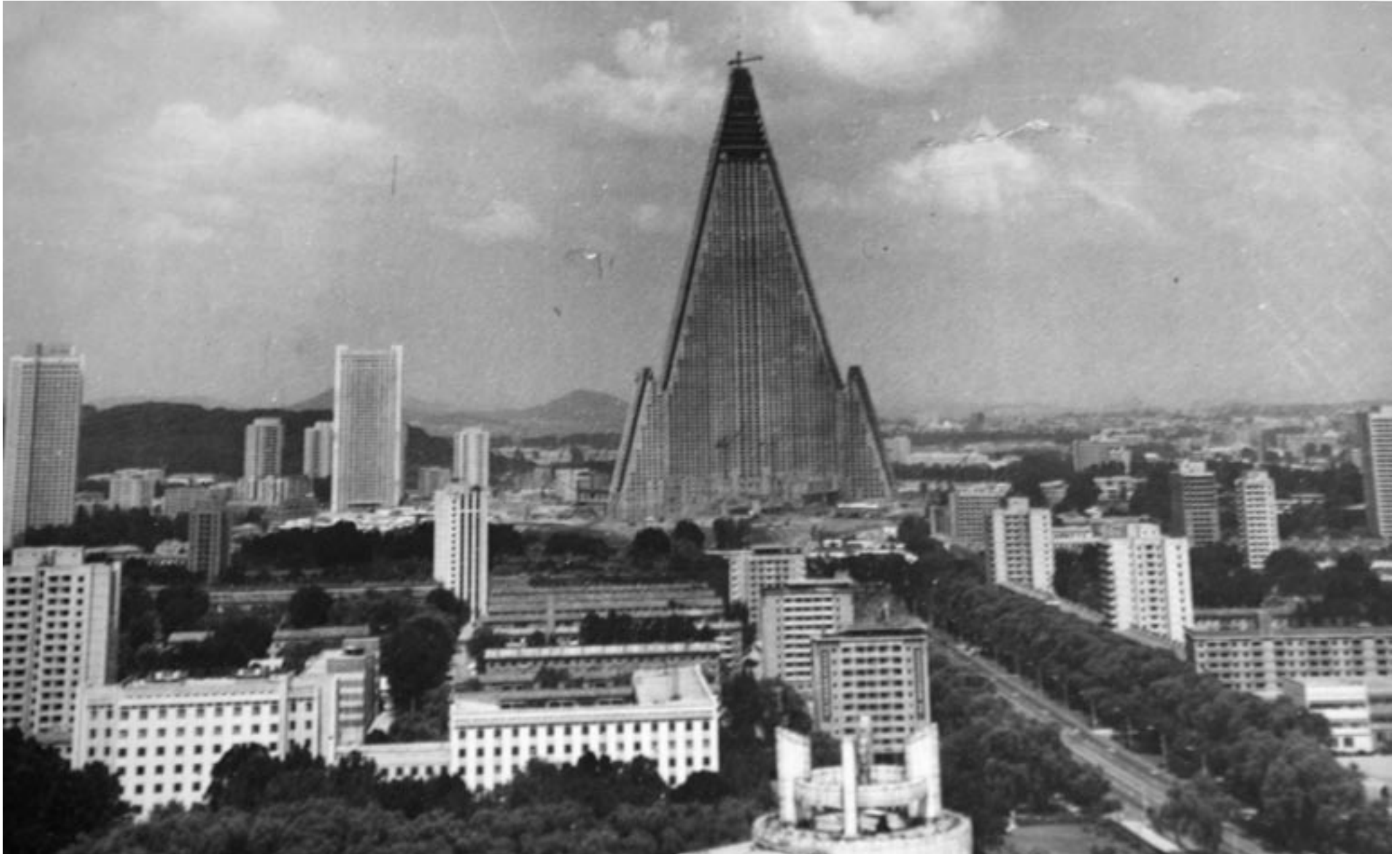
Abbildung des Ryungyong Hotel Pyongyang in der Akademie der Architektur Paektusan Pjöngjang, April 2007